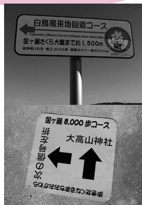
▲ウォーキングコース上に、誘導看板や路面サインを設置。