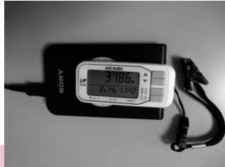
▲アクセスポイントにあるパソコンのリーダーに歩数計を乗せると2週間分の歩数が入り込まれます。

第1期システム登録者300人には専用歩数計を送付しました。これからの申込みは4月中旬頃システムに参加となります。お待ちください。