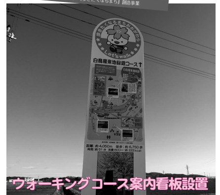
▲5つのウォーキングコースを設定し、コースの案内看板を各コースに設置。