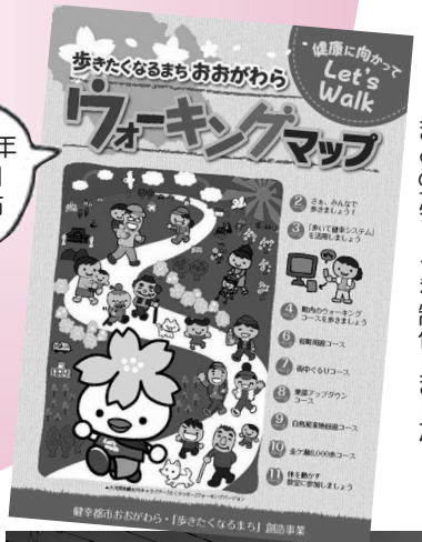
▲おすすめのウォーキングコースをまとめたマップを制作しました。