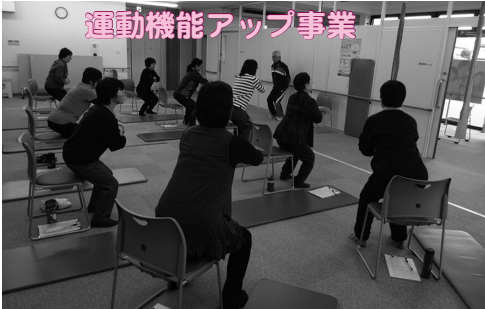
▲ウォーキング教室やコンディショニング教室など、歩くことに対して楽しさを混じえて行いました。