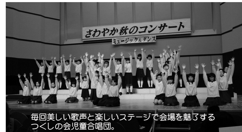
毎回美しい歌声と楽しいステージで会場を魅了するつくしの会児童合唱団。