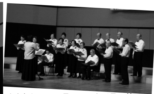
▲カトリアコーラスのアカベラの美しい歌声が会場に響き渡りました。