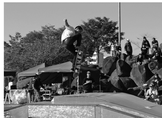
▲技が決まると場外から大きな拍手が沸き起こりました。

当日は、プロスケーターによるプレミアムスケートスクールやデモンストレーションがあるということで、町内外から大勢のスケートボード愛好者が集結しました。会場では、大人から子どもまでフリーでスケートボードを楽しんだり、プロの滑りに歓声と拍手が沸いたり、芋煮汁なども振る舞われ、終始賑わいを見せました。