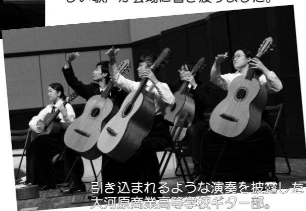
引き込まれるような演奏を披露した大河原商業高等学校ギター部。

9月2日から開催されている町民文化祭の一つとして、11月3日、「さわやか秋のコンサート（主催：大河原町文化協会・大河原町中央公民館・大河原町金ヶ瀬公民館）」がえびこホールを会場に開催されました。