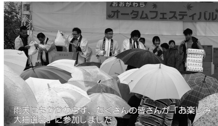
雨天にもかかわらず、たくさんの皆さんが「お楽しみ大抽選会」に参加しました。

当日は時折強い雨が降るあいにくの天気となり、スケジュールやイベントの内容を大幅に変更しながらの開催となってしまいましたが、来場者は出店やフリーマーケットなどで買い物をしたり、各種アトラクションに参加したり、雨天を気にせずお祭りを満喫していました。