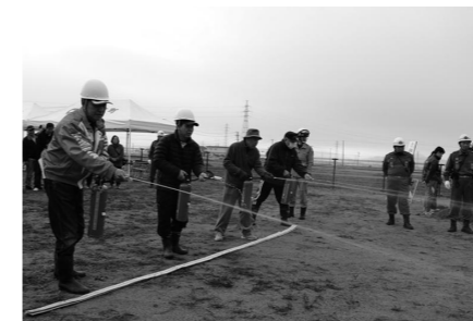
▲火災を想定した消火訓練を体験する地域の皆さん。

11月20日、大規模災害発生を想定した「総合防災訓練」が、橋本交流センターで開催されました。