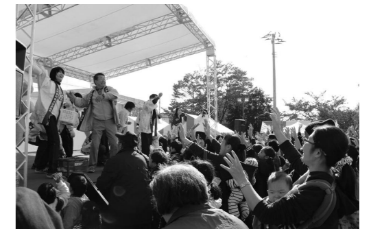
▲もちまき大会では、大人から子どもまで無我夢中に。

晴天にも恵まれ、会場には開始前からたくさんの人が訪れました。訪れた皆さんは出店やフリーマーケットなどで買い物をしたり、ステージショーや各種アトラクションを楽しんだりして時間が経つのも忘れてお祭りを満喫しました。