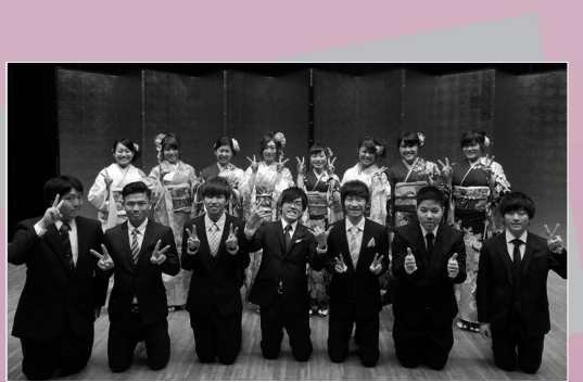
▲成人式を盛り上げようと、長期間準備をし てきた実行委員の皆さん。当日も司会進行 や受付などを自分たちでやり遂げました。