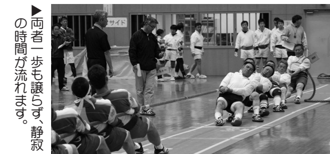
▶ 両者一歩も譲らず、静寂の時間が流れます。

今回は、東北6県から男子、女子、混合の3部門に分かれて22チームの力自慢の皆さんが集結。どのチームも1試合1試合気合の入った戦いとなり、会場は選手たちの熱気に包まれました。