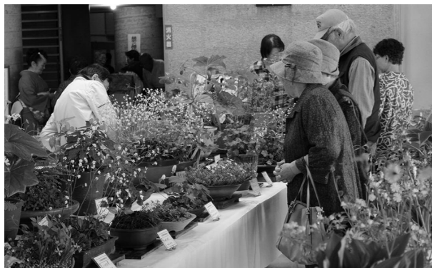
▲ 珍しい山野草の前で、足を止め、見入る来場者。