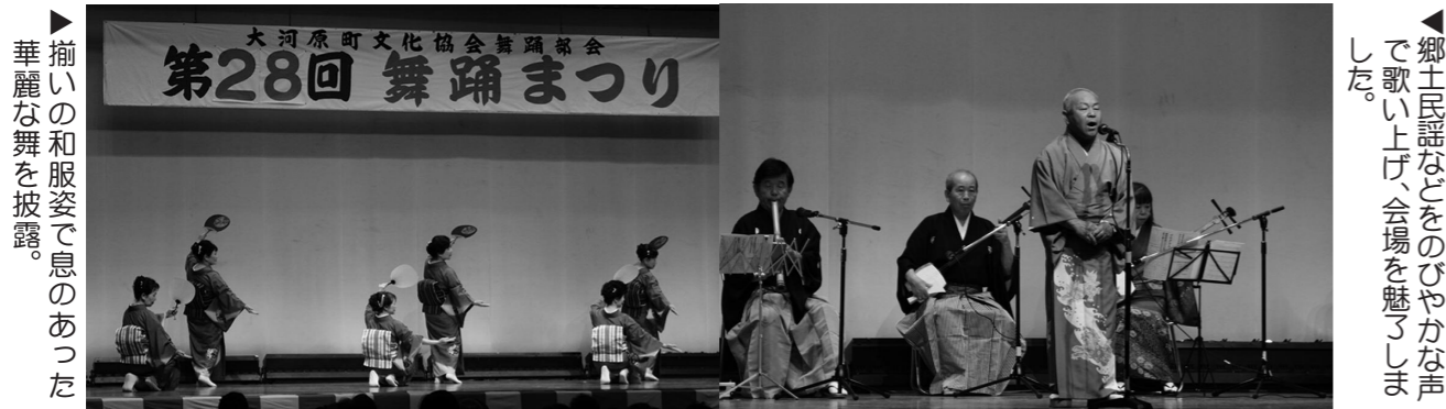
▶ 揃いの和服姿で息のあった華麗な舞を披露。

大河原町文化協会に加盟する団体により、4月24日に「第28回大河原舞踊まつり（主催：町文化協会舞踊部会）」と、5月8日に「第42回大河原民謡祭（主催：町文化協会民謡団体）」が中央公民館で開催されました。出演者は大勢の観客を前に、日頃の練習の成果を存分に披露しました。場内からは盛んに拍手や歓声があがり、両日も大勢の来場者で賑わいました。